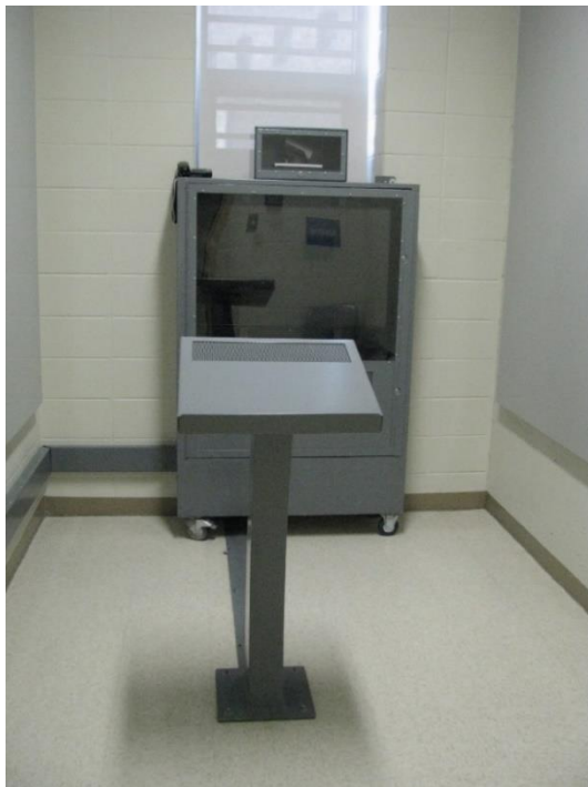
Salle de visioconférence

Largeur : 7' 7" ou 2,35 m Profondeur : 11' 8" ou 3,60 m